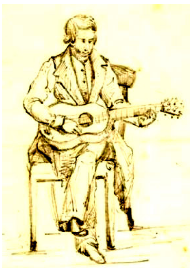
< Berlioz adolescent jouant de la guitare

mise au point par Torrès vers 1870 & jouée ici par Francisco TARREGA