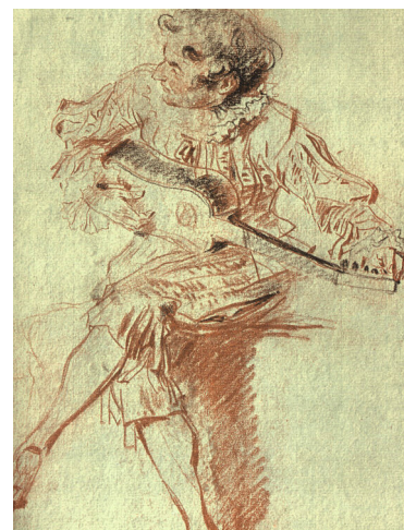
Guitare baroque (par Watteau)